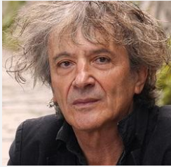
Figure majeure des lettres contemporaines, Hubert Haddad maîtrise aussi bien le roman que la dramaturgie. Auteur d'une œuvre récompensée par de prestigieux prix (notamment Palestine ou Le Peintre d'éventail ), il est un écrivain de la complexité, attentif aux fractures du monde et aux territoires de l'exil. Il pense l'écriture théâtrale comme un art vivant, lieu de liberté et de résistance poétique.